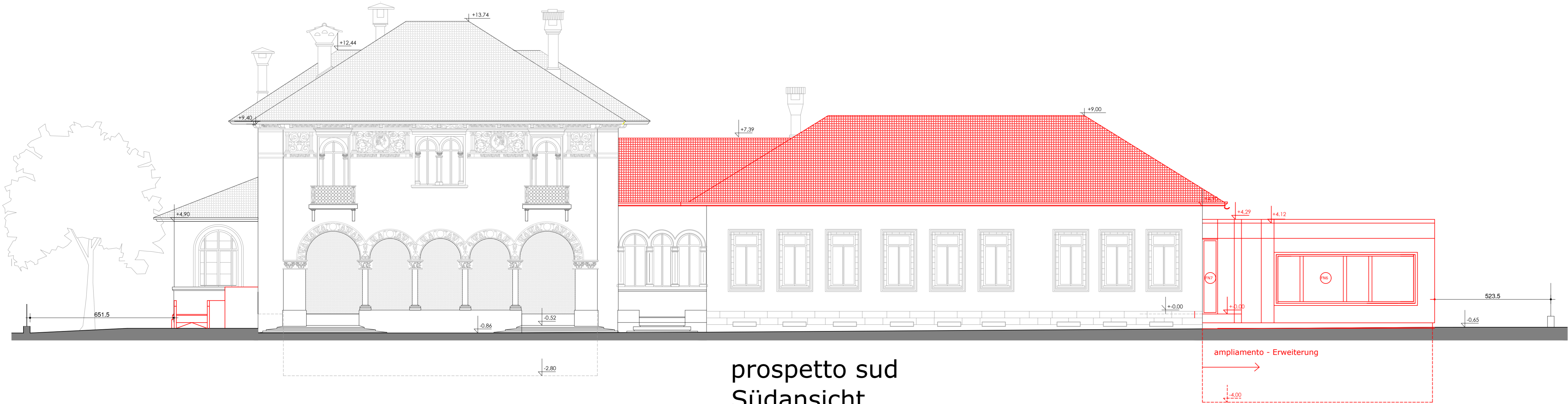
prospetto sud Südansicht