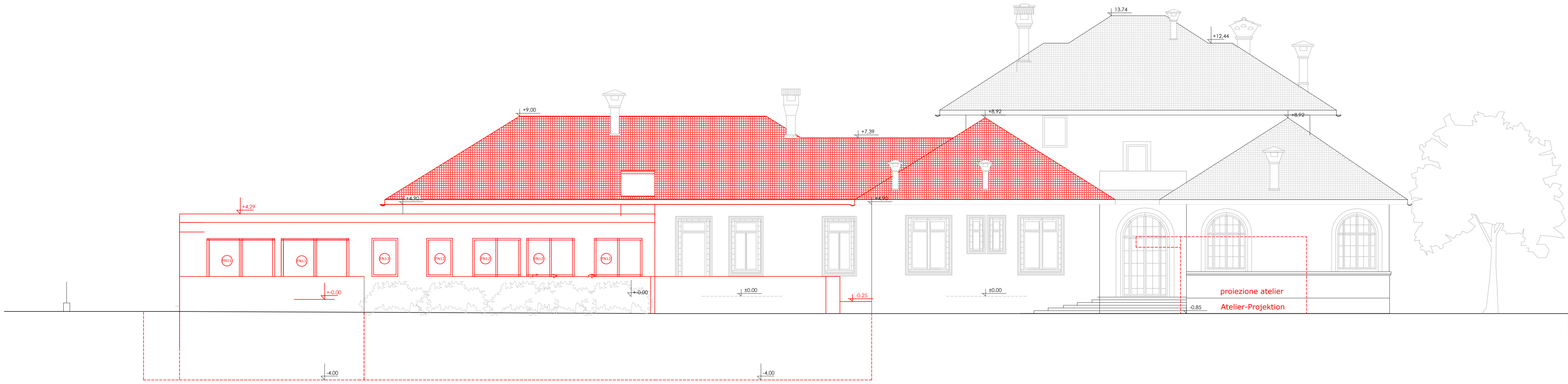
prospetto nord Nordansicht